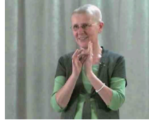
2. Geistiges Reisen