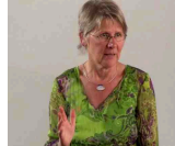
9. Kapital Geld