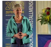
7. Männer Frauen