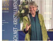
8. Tod und Leben