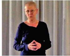
3. Haus Landschaft